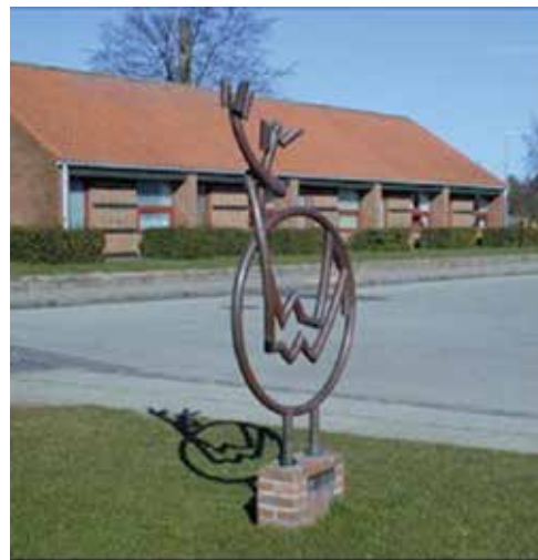
Det har desværre ikke været muligt at få et større billede, da skulpturen pt. er under reparation.