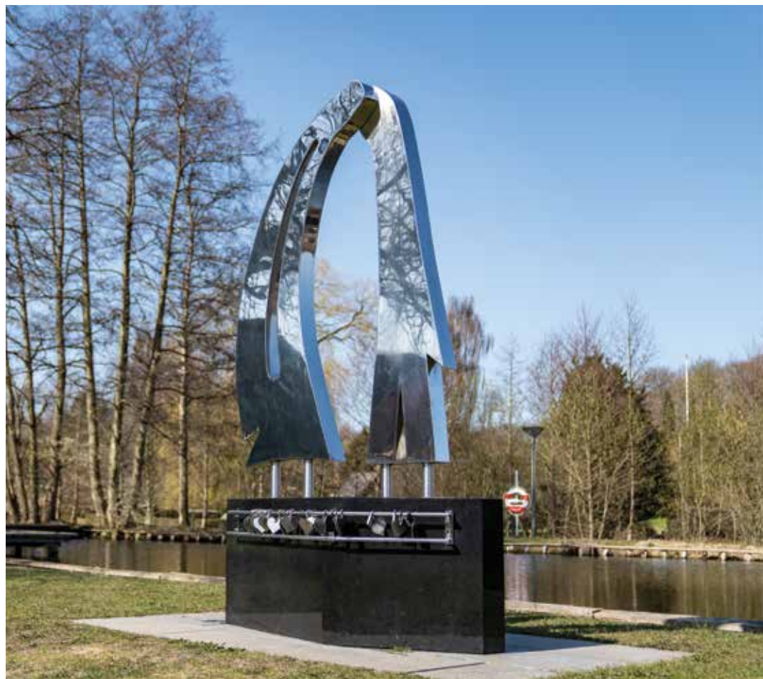
ODDER MUSEUM, MØLLEVEJ