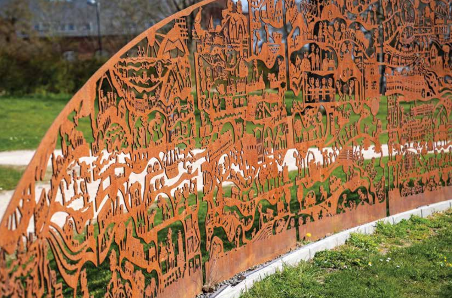
VITAPARK, VITAVEJ / RANDEVVEJ