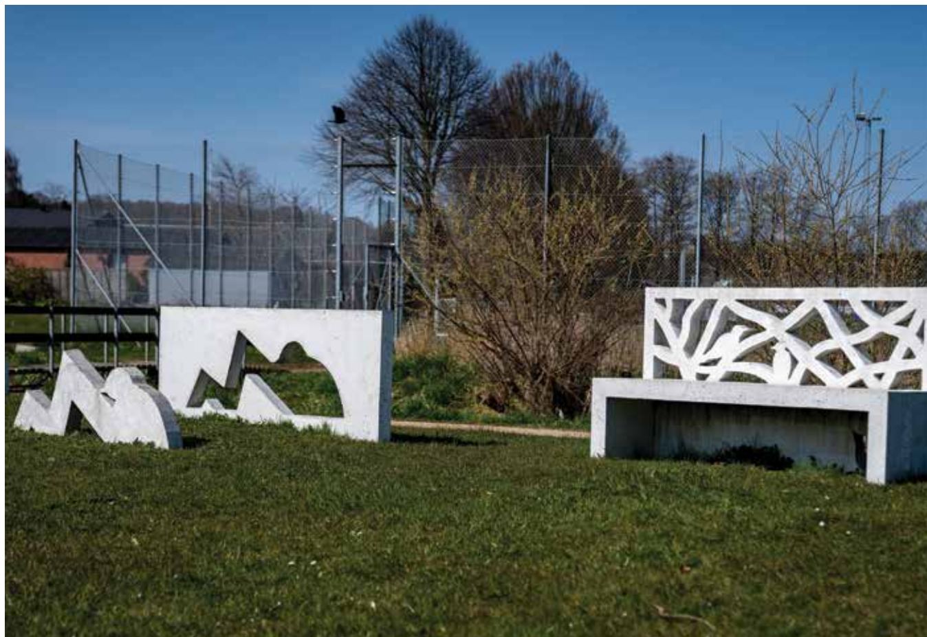
Finn Have , billedkunstner (1952): Fuglebænken m.m., 2016.